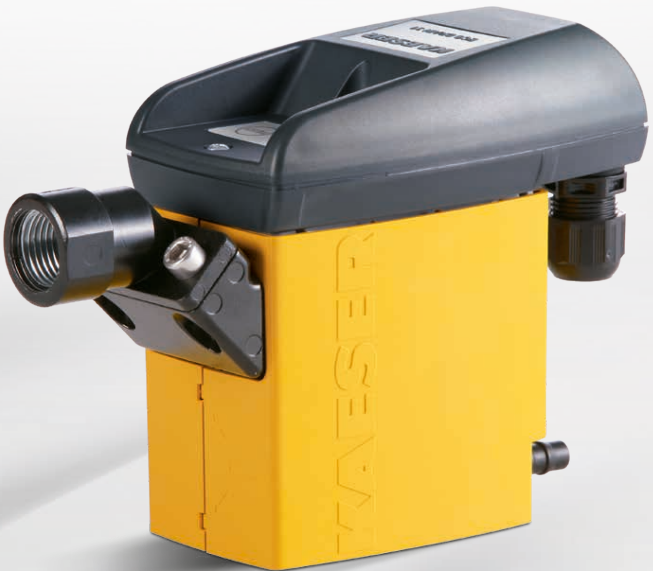
Abb.: ECO-DRAIN 31